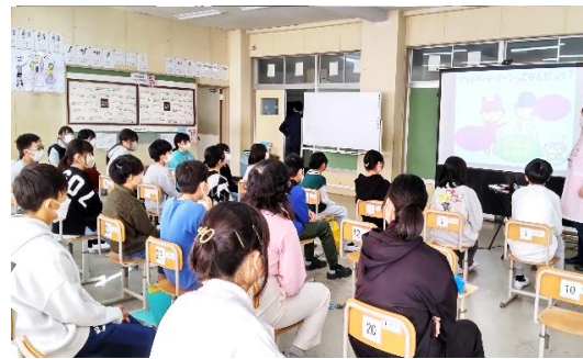
体と心はだれのもの?