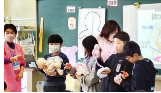
赤ちゃん人形をだっこしてみよう